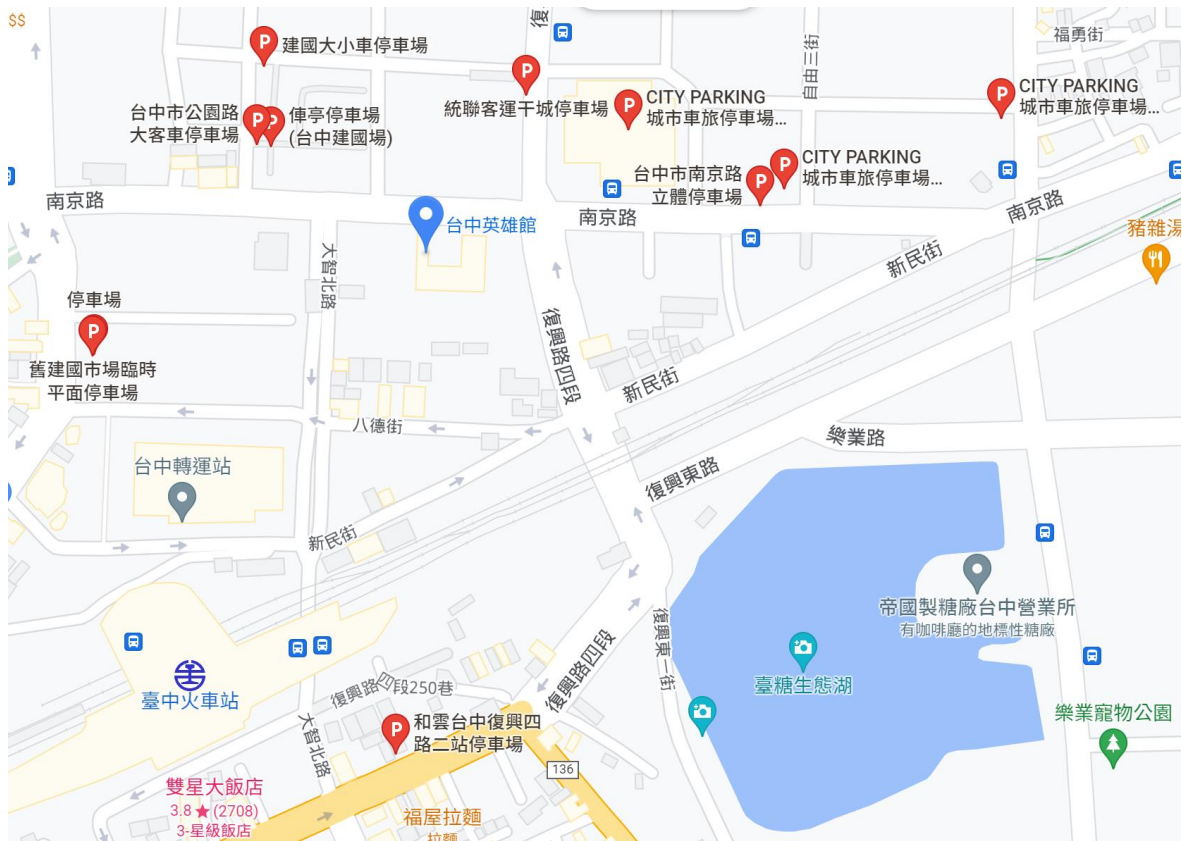
附圖一 臺中英雄館位置圖